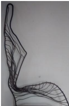
Sucata: perfil de mulher