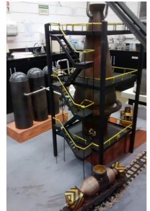
Maquete de um alto forno siderúrgico